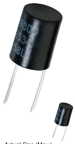
Actual Size (Max.)